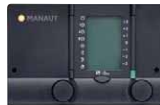
Centralita de regulación