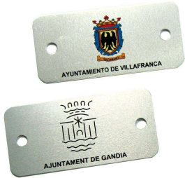
Plaqueta aluminio 74 x 35 mm.