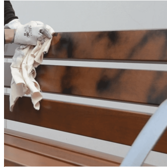
Protector del material de pinturas y rotulaciones.