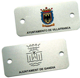
Plaqueta aluminio 74 x 35 mm.