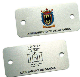
Plaqueta aluminio 74 x 35 mm.