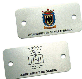
Plaqueta aluminio 74 x 35 mm.