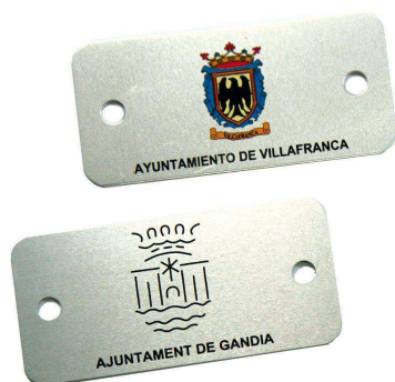
Plaqueta aluminio 74 x 35 mm.