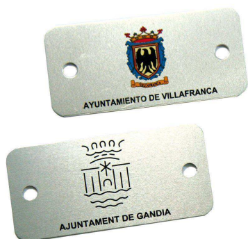
Plaqueta aluminio 74 x 35 mm.