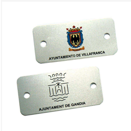
Plaqueta aluminio 74 x 35 mm.