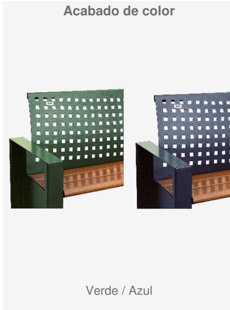
Verde / Azul