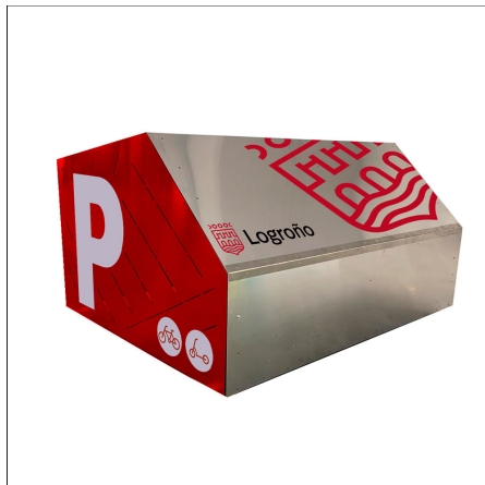
Diseño y colores CORPORATIVOS