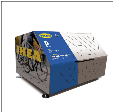
VSB04PE Totalmente personalizable