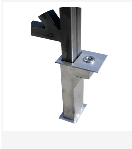
VVBA84M/1 - VVBA164M/1