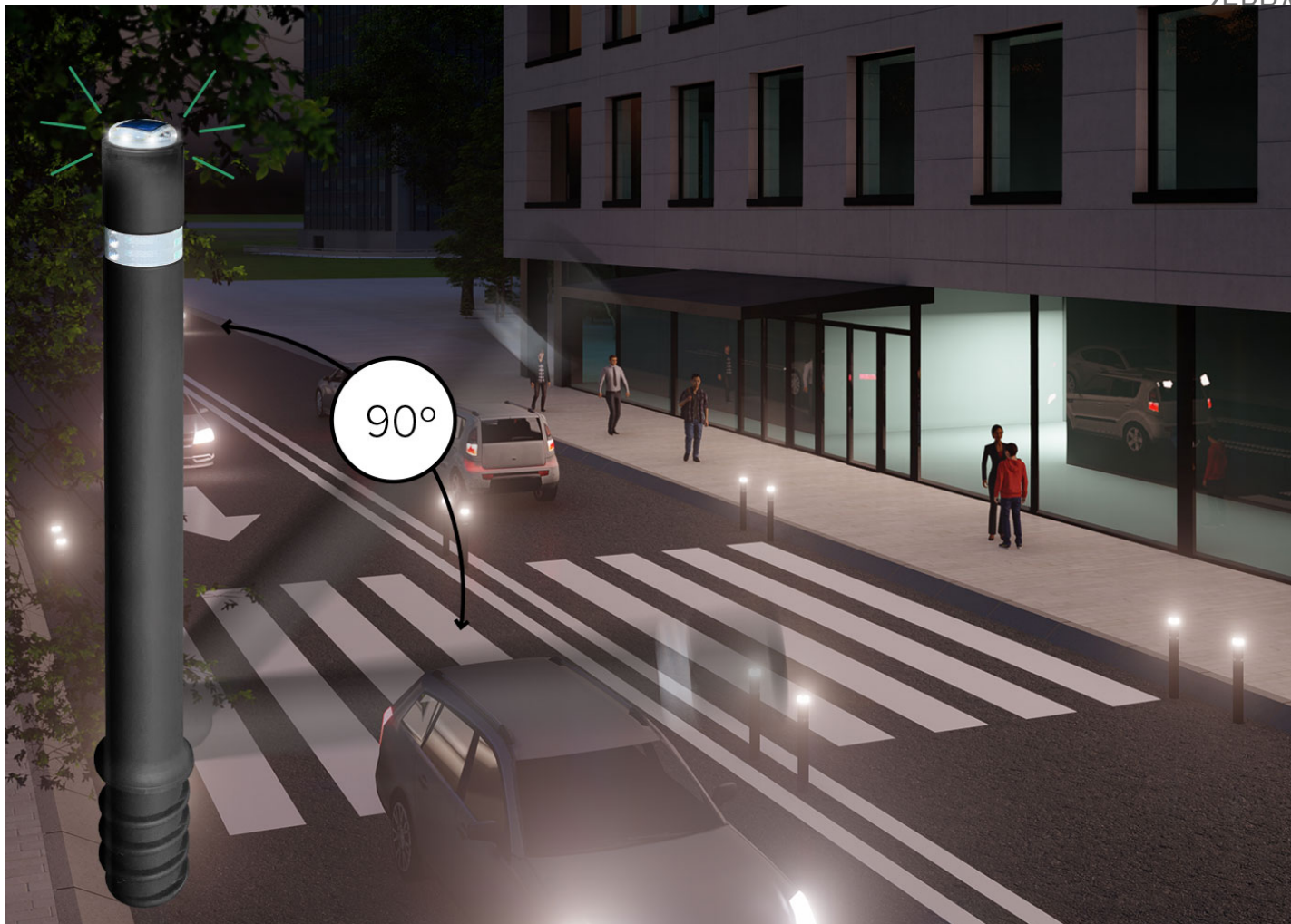
anti atropello de alta seguridad, iluminación LED ZEBRAPLUS