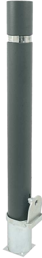
HOSPITALET DURABLE H214F