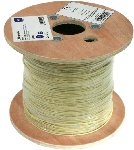
CFO 1 900 Bobina de madera