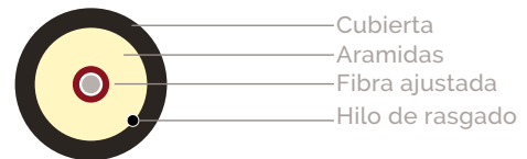
CFO 1 900N