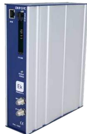
CM IP CI-TC