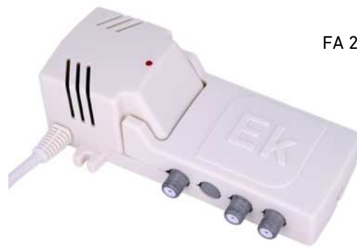
FA 242 / FA 121