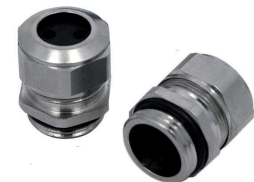
2FPG11 (Para ON 129 AC)