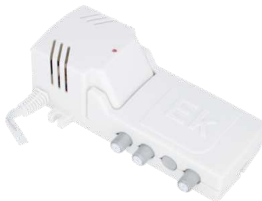
MAD 382 L2