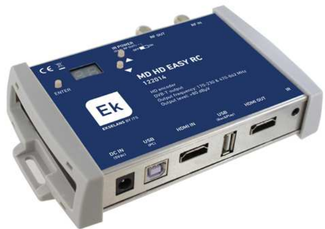
MD HD EASY RC