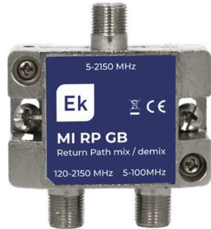
MI RP GB