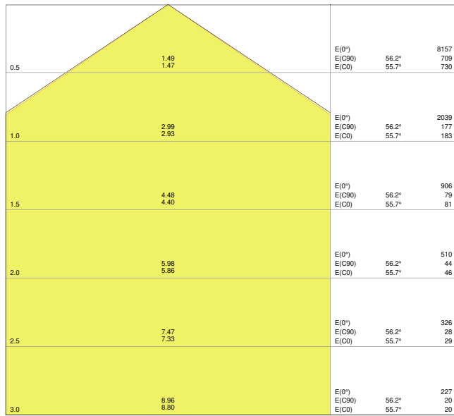
LDC typ cone