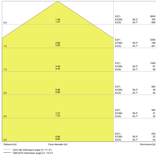
LDC typ cone