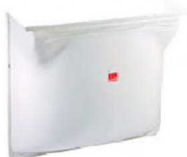
Cuerpo tragaluz sin reja. Art.nº.: 00038766