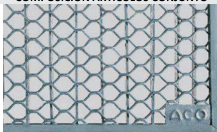
Reja entramada en acero galvanizado para soporte de carga 1,5KN peatonal. Art.nº.: 00038770