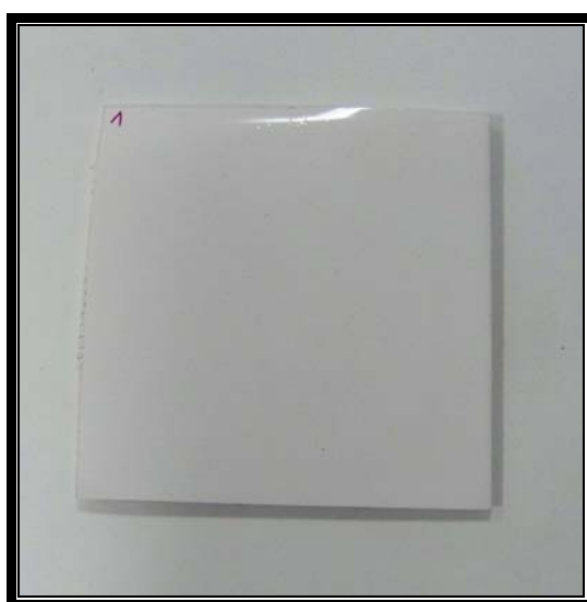
Fotografía de la muestra ensayada

En el anexo se incluye la ficha técnica del material ensayado facilitada por el cliente.