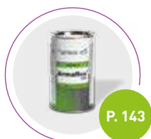
Adhesivo Armaflex 520