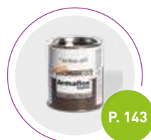
Adhesivo Armaflex RS850