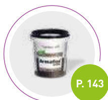
Adhesivo Armaflex SF990