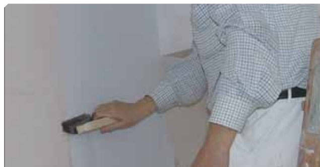
■ Alisado con cepillo para evitar la oclusión de aire