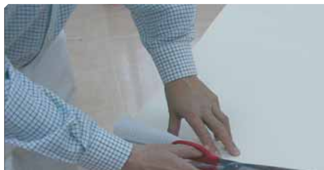
■ Corte del papel