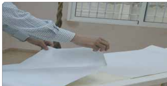
■ Doblado de las piezas de papel cortadas