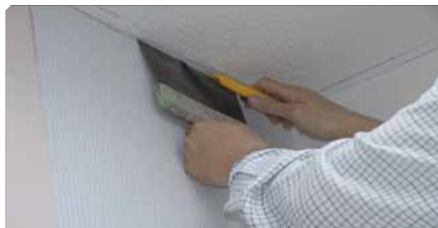
■ Corte del papel sobrante