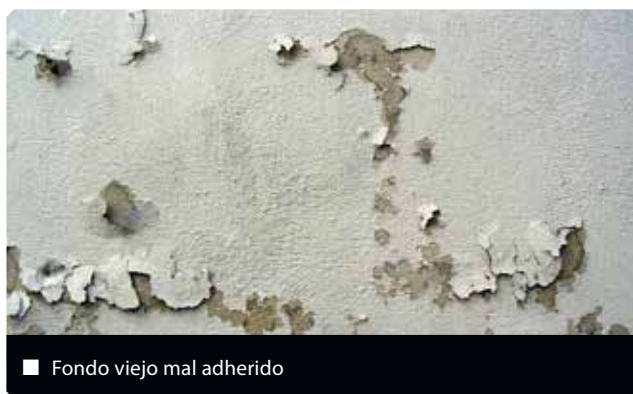
■ Fondo viejo mal adherido