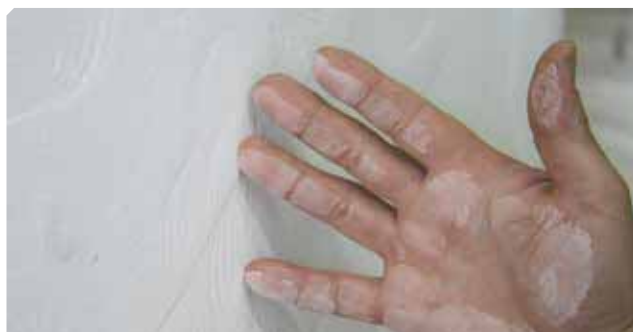
■ Soporte pulverulento.