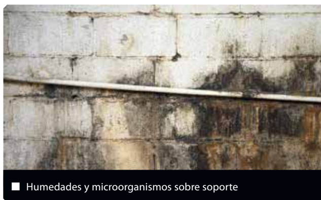
■ Humedades y microorganismos sobre soporte