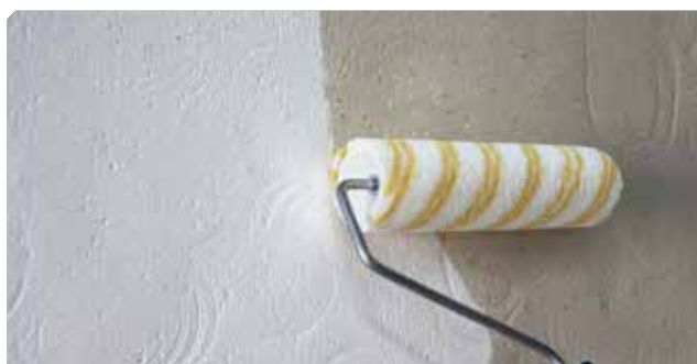
■ Imprimación del soporte con fijapren al disolvente