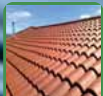
Cubiertas de teja