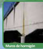
Muros de hormigón