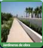
Jardineras de obra