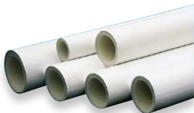
Tubería PEX/AL/PEX en Barra - PEX/AL/PEX Pipes in bars - Tubes en barre PEX/AL/PEX