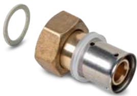
Racor Móvil - Female Loose Fitting - Raccord Femelle Ecroû Tournant