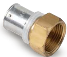
Racor Fijo Rosca Hembra - Fixed Fitting with Female Thread - Raccord Femelle Fixe