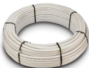
Tubería PEX/AL/PEX en Rollo - PEX/AL/PEX Multilayer Pipes - Tubes Multicouche PEX/AL/PEX