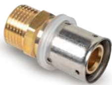
Racor Fijo Rosca Macho - Fixed Fitting with Male Thread - Raccord Mâle Fixe