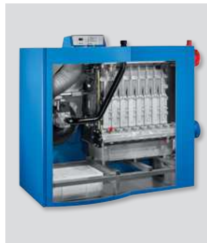
Interior de caldera de condensación Logano plus GB402.

Con tres modelos de armarios, los equipos Logablok plus MODUL GB402 disponen de la más amplia gama desde los 320 kW a 1860 kW. Un armario de modelo para una única caldera desde 320 a 620 kW; otro para combinaciones de dos calderas con potencias desde los 640 a 1240 kW y un tercer armario para combinaciones de tres calderas de cualquier potencia, con potencias desde 960 kW hasta 1860 kW.