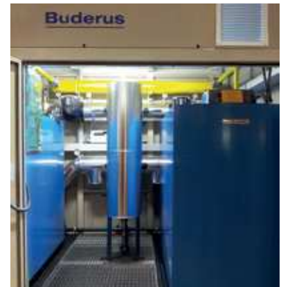
Equipamiento hidráulico de un equipo formado por dos calderas GB402 con compensador hidráulico.

Todos los componentes importantes de la caldera son accesibles desde el frontal o el lateral de la misma, lo que facilita los trabajos de servicio técnico y mantenimiento. Además el quemador se puede montar y desmontar con facilidad.