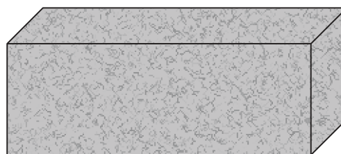
CASETÓN HORMIGÓN MODELO R.H.