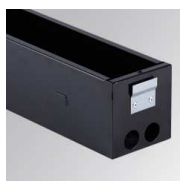
Cód. producto: Descripción: 10200923 BAZZ ACC. 2M REC BOX