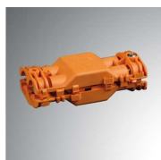
Cód. producto: Descripción: 9600180 ACC. IP68 Ø6,5-12MM CONNECTOR