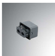
Cód. producto: Descripción: 9600170 ACC. IP68 Ø8-10MM CONNECTOR