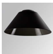
Cód. producto: Descripción: 10400102 STORBELL ACC. BELL BK.