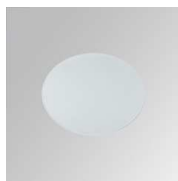
Cód. producto: Descripción: 10400150 STORBELL ACC. OPAL GLASS