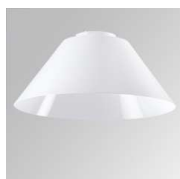
Cód. producto: Descripción: 10400120 STORBELL ACC. BELL OPAL