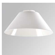
Cód. producto: Descripción: 10400100 STORBELL ACC. BELL WH.