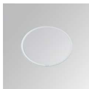
Cód. producto: Descripción: 10400140 STORBELL ACC. TRANS GLASS