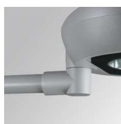
Cód. producto: Descripción: 9600333 NIU ACC. Ø48 POLE BRACKET 9600343 NIU ACC. Ø60 POLE BRACKET