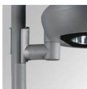
Cód. producto: Descripción: 9600323 NIU ACC. IND Ø60-135 POLE CLAMP