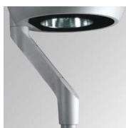
Cód. producto: Descripción: 9600313 NIU ACC. IND Ø60 ARM