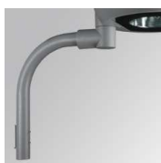
Cód. producto: Descripción: 9600363 NIU ACC. WALL ARM