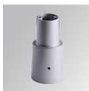
Cód. producto: Descripción: 9600353 NIU ACC. Ø76 POLE ADAPTER