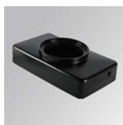
Cód. producto: Descripción: GAREBOB GAP ACC. REC BOX