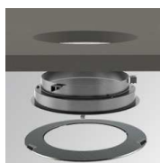
Cód. producto: Descripción: GARERIRDM GAP ACC. REC CEILING RING