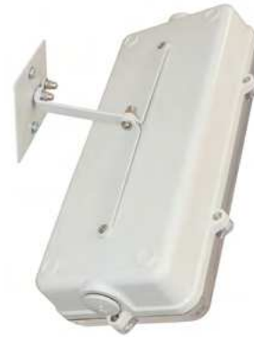
Ref. COBEL PVP. 18,98 €

Conjunto de orientación de acero con pintura epoxi en color gris RAL 7035 para caja de estanqueidad BE-L