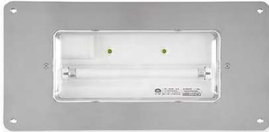
Ref. MBEL-I 386 x 196 mm PVP. 25,54 €