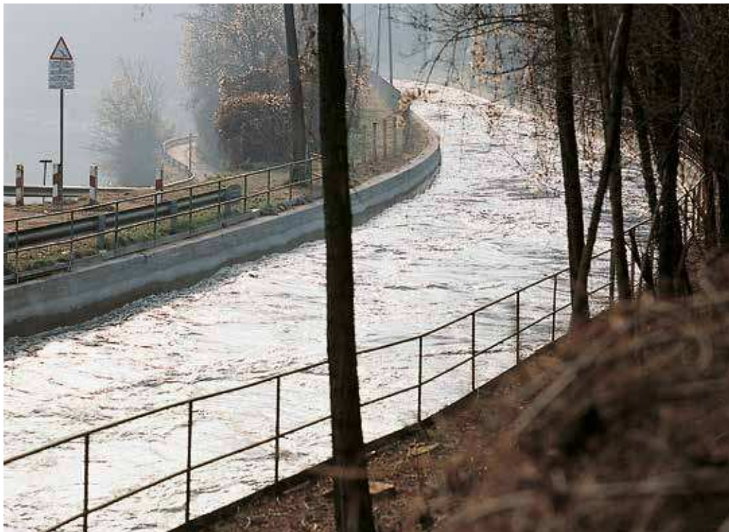
Canal hidroeléctrico Bertini-Robbiate (CO), tratado en su superficie con Planiseal 88