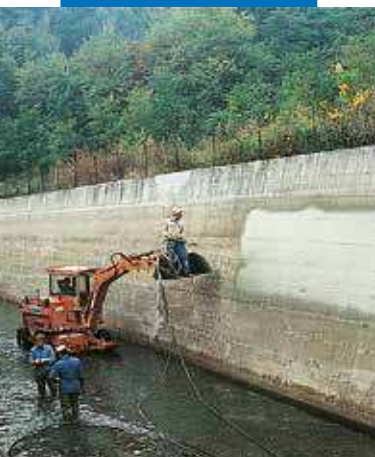
Aplicación por proyección de Planiseal 88 en un canal hidroeléctrico