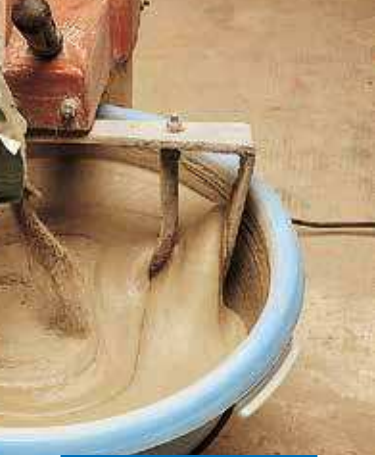
Mezclado de Planiseal 88 gris con agua