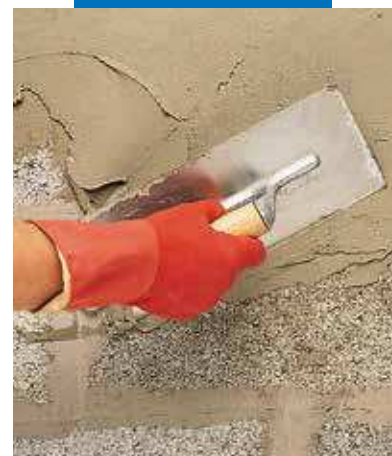
Aplicación de Planiseal 88 a llana