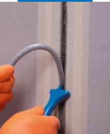
Insertar Mapefoam en el interior de la sede de la junta