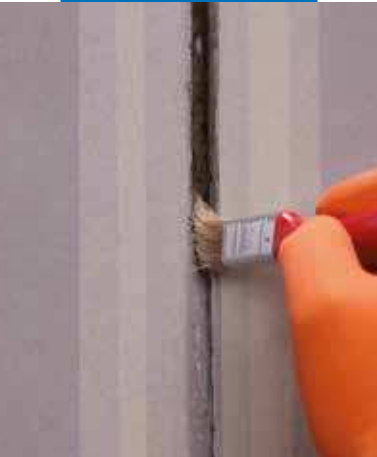
Aplicación de Primer M

Mapeflex PU40 es nocivo y puede provocar, en caso de inhalación, reacciones alérgicas