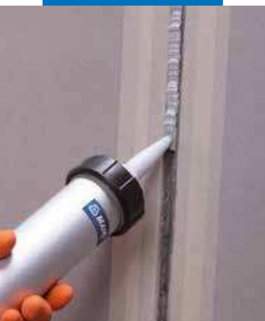
Aplicación de Mapeflex PU40