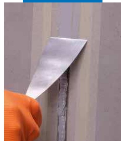
Alisado de Mapeflex PU40