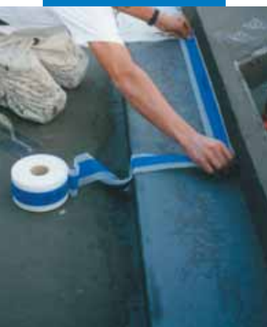
Ejemplo de impermeabilización con Mapeband del encuentro entre la losa y el muro de un depósito