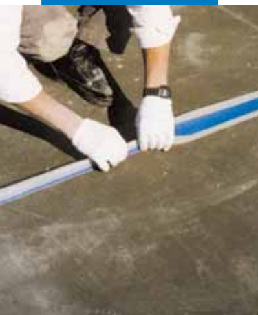
Ejemplo de impermeabilización de una junta estructural en una terraza