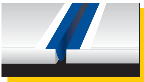
Colocación en omega de Mapeband en el interior de la junta de dilatación