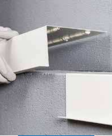
Encolado elástico de elementos constructivos