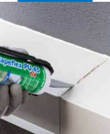
Sellado elástico de juntas de construcción

del aire y, gracias a sus características, ofrece elevadas garantías de durabilidad, pudiéndose emplear tanto sobre superficies horizontales como verticales.