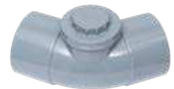
Codo registrable H-H 45°