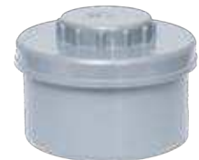
Tapón de registro roscado