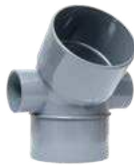
Codo M-H 45° con doble toma lateral Ø50