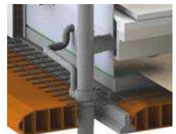
Ejemplo de instalación embutido