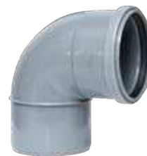
Codo M-H 87° 30' con junta elástica