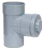
Injerto 87° 30' M-H registrable