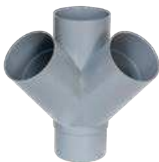
Injerto doble a escuadra M-H 45°