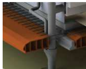
Ejemplo de instalación bajo forjado