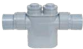
Sifón en línea registrable