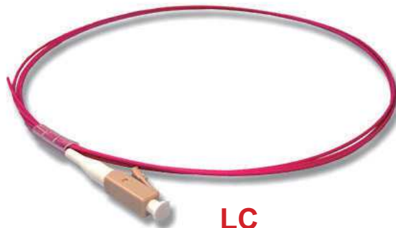
LC P/N: 50575