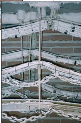
Figura 3. Estado final tras el ensayo