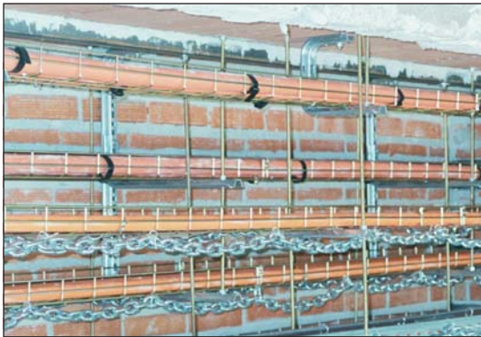
Figura 1. Vista general del montaje