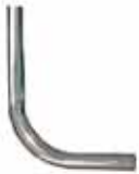
Tubo curvo para Presto 1000 M