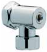
Llave de paso para Presto 1000 M