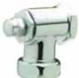
Llave de paso para Presto EYREM