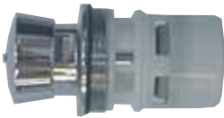
Mecanismo para Presto ECLAIR