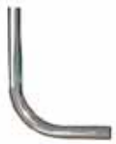
Tubo curvo para Presto ECLAIR