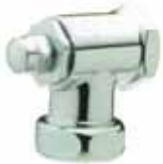
Llave de paso para Presto ECLAIR