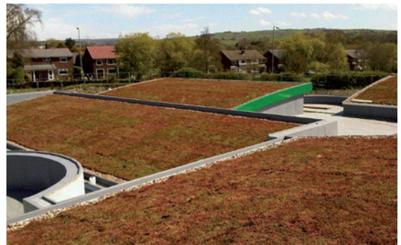
2 Escuela (Inglaterra)