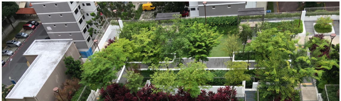
3 Bloque de apartamentos (Singapur)