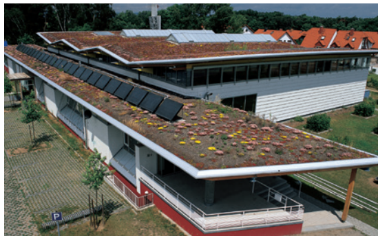
1 Centro Deportivo (Alemania)

*Algunas plantas como el bambú deben evitarse debido a la agresividad de sus raíces. Para obtener una lista completa de plantas prohibidas en el marco de cubiertas ajardinadas: Cf: « Krupka, Bernd. Dachbegrünung – Pflanzen und Vegetationsanwendung an Bauwerken ». Stuttgart, Ulmer. 2000)