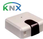
IS-IR-KNX-1i (CL 99 096)