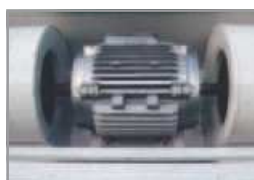
Motor de doble eje