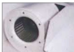
Ventilador centrífugo de alta capacidad