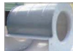
Carcasa del ventilador metálica