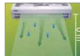
Altura máxima de instalación 6m