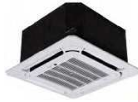
Modelos 14 y 16