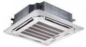
Modelos 20 a 36