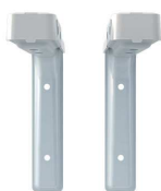
Soporte MU-WING-10 (EC 06 280)