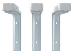
Soporte MU-WING-15/20 (EC 06 281)