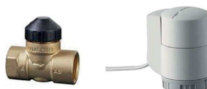
Válvula + Actuador (CO 23 307 + CO 23 302)