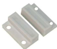
Sensor de puerta (EC 06 284)