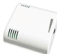
Potenciómetro 0-10V (1) (EC 06 282)