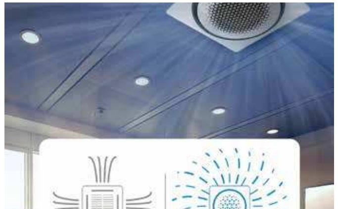
**La diferencia de temperatura es inferior a 0,6°C en un radio de 9,3 m.