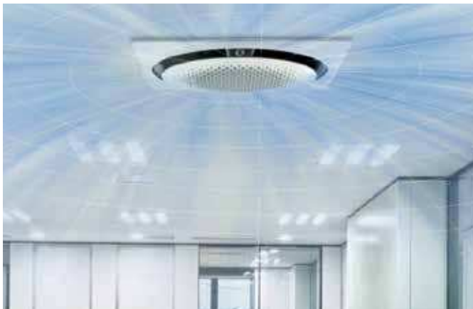
*Pruebas comparativas realizadas por Samsung con un cassette de 4 vías. **La diferencia de temperatura es inferior a 0,6°C en un radio de 9,3 m.

El diseño sin lamas dispersa el aire fresco con suavidad por toda la habitación, produciendo una cómoda sensación de frescor, sin corrientes de aire frío**. Y, como no hay lamas que bloqueen el flujo de aire, la unidad emite un 25% más de aire* y a mayor distancia.