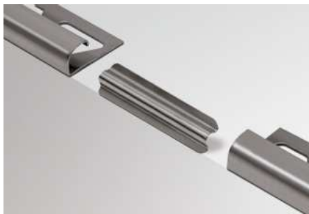
Schlüter®-RONDEC-E/V (Empalme para perfiles de acero inoxidable)