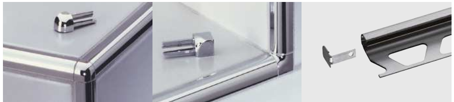
Schlüter®-RONDEC Esquinas exteriores e interiores