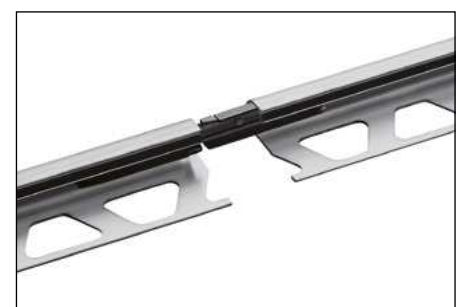
Schlüter®-RONDEC-AV (Empalme para perfiles de aluminio)